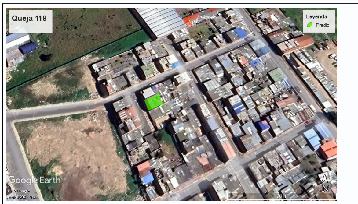
Ilustración 1. Ubicación

Teniendo en cuenta que ante el municipio de Funza se interpuso queja por presunta quema a cielo abierto, el día 05 de Agosto personal adscrito a la Secretaría de Ambiente y Bienestar Animal realizó inspección, de conformidad con el acta de visita ambiental No 118 en el predio ubicado en la dirección calle 18a # 7a-60 barrio Mexico (ver ilustración 1. Polígono Verde), en las coordenadas 4°42'47,856" N- 74°12'19.104" W .