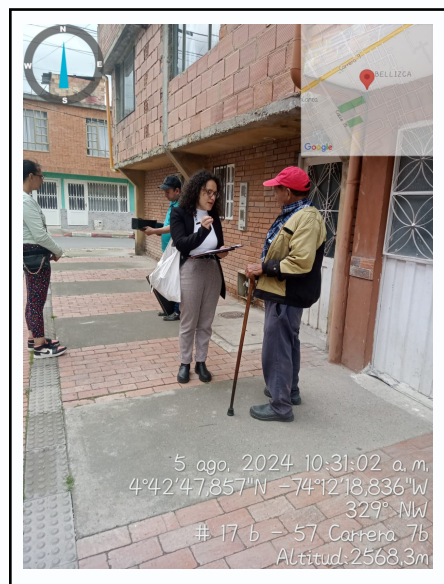
Ilustración 4. Atención a Queja

Así mismo, las quemas abiertas, fogatas domésticas o con fines recreativos están permitidas siempre que no causen molestias a los vecinos, de conformidad con el artículo 2.2.5.1.3.13.. de la sección 3, capítulo 1 del Decreto 1076 de 2015 "Por medio del cual se expide el decreto único reglamentario del sector ambiente y desarrollo sostenible".