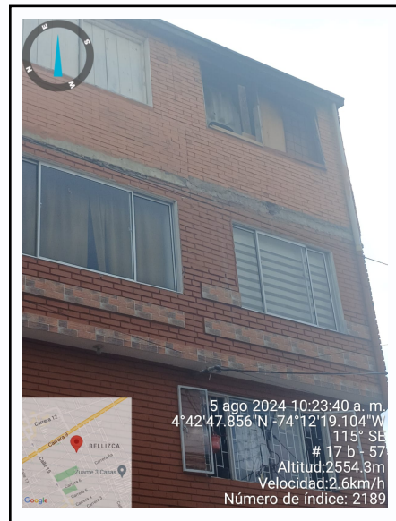
Ilustración 2 Ubicación del Predio

El predio se encuentra identificado con cédula catastral 252860100000000150074000000000, de conformidad con la consulta realizada en el geoportal del Instituto Geográfico Agustín Codazzi -IGAC.